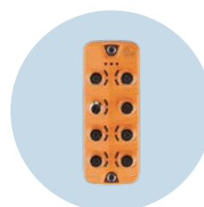
IO-Link-Master Feldtaugliche Master mit Profinet-Schnittstelle