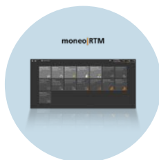
moneo|RTM 用于简单状态监测的分析软件