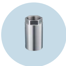
天线扩展件 用于在封闭储罐外部使用传感器

我们保留进行技术变更的权利, 恕不另行通知。-02.2024 ifm electronic gmbh · Friedrichstr. 1 · 45128 Essen