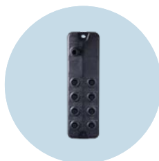
AutomationLine DX-Modul 8 unabhängig voneinander parametrierbare E/A-Ports