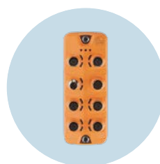
Mestre IO-Link Mestre de campo com interface PROFINET