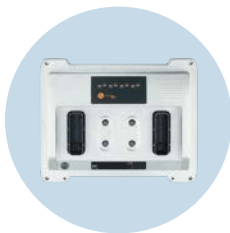
Electrónica de control Controlador estándar y de seguridad en un solo equipo

Nos reservamos el derecho de modificar características técnicas sin previo aviso. · 11.2023 ifm electronic gmbh · Friedrichstr. 1 · 45128 Essen