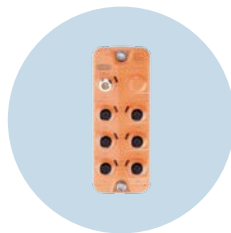
Switch Ethernet Amplía la infraestructura de vehículos en 6 puertos