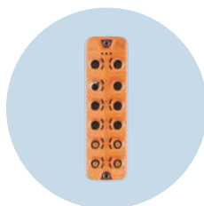
IO-Link主站 适用于卫生区域的现场兼容主站