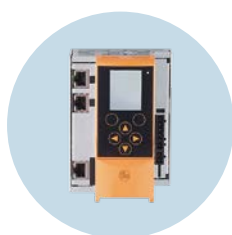
Pasarela AS-i Con interfaz PROFINET y PLC integrado

Nos reservamos el derecho de modificar características técnicas sin previo aviso. · 11.2024 ifm electronic gmbh · Friedrichstr. 1 · 45128 Essen