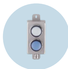
Módulo con pulsador luminoso AS-i Botones iluminados en carcasa de acero inoxidable