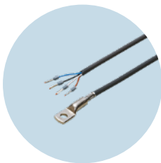
온도 센서 정확한 온도 측정