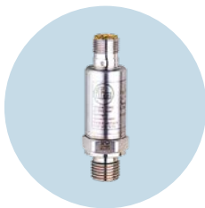
압력 센서 정확한 압력 값 및 레벨 측정