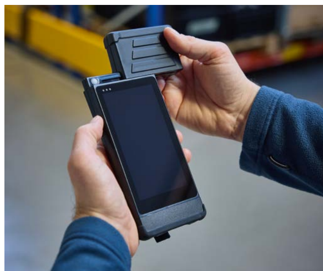
Os vários módulos de antena na borda superior do leitor portátil podem ser substituídos facilmente.