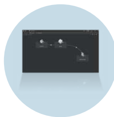
moneo|Track & Trace Rastreamento e otimização dos fluxos de mercadorias