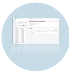
Integração do chão de fábrica Transmite dados de sensores diretamente aos processos SAP ERP