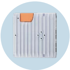
邊緣閘道器 用於將系統資料安全傳輸至 IT 層級