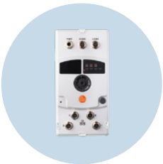
edgeGateway 實地應用 從嚴苛的工業環境中安全傳輸資料