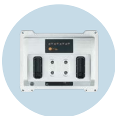
ecomatController Mobiltaugliche Steuerung, auch für Safety-Applikationen

Technische Änderungen behalten wir uns ohne vorherige Ankündigung vor. · 11.2023 ifm electronic gmbh · Friedrichstr. 1 · 45128 Essen