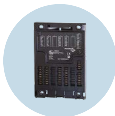
BasicController Steuerung mit H-Brücke, 16 Ein- und Ausgänge