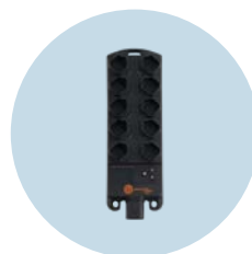
ioControl Dezentrale Anbindung von Sensoren, frei programmierbar