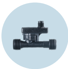
Caudalímetro Vortex Controla el caudal y la temperatura en tuberías de agua