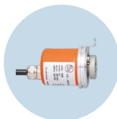
Encoder multigiro Rilevamento esatto di posizioni e rotazioni