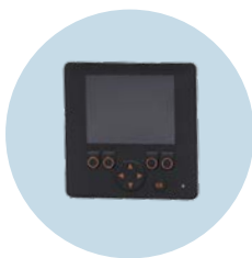
Display grafico HMI programmabile per il controllo di macchine mobili

Ci riserviamo il diritto di apportare modifiche tecniche senza preavviso. · 09.2023 ifm electronic gmbh · Friedrichstr. 1 · 45128 Essen