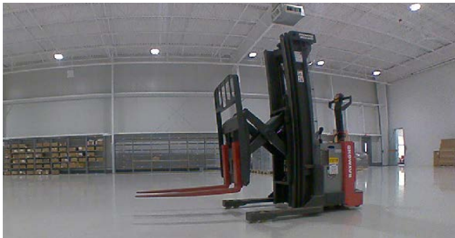
La piattaforma robotica rileva la situazione in un'immagine 2D e in dati di distanza 3D.

I sistemi di trasporto autonomi devono superare due sfide principali: da un lato, devono evitare collisioni con oggetti e persone, dall'altro aggirare autonomamente gli ostacoli. Gli scanner di sicurezza spesso utilizzati non sono di grande aiuto in questo caso, in quanto rilevano solo il percorso ad un livello appena sopra il suolo. È qui che la piattaforma per telecamere mostra il suo vantaggio: elabora i segnali provenienti da un massimo di sei telecamere 3D PMD installate intorno al veicolo e valuta l'ambiente in modo tridimensionale, ossia sia l'area del terreno al di sotto del campo visivo degli scanner di sicurezza (es. buche nel terreno) sia la vista in diagonale verso l'alto. In questo modo vengono rilevati anche i carichi sospesi, come ad esempio i ganci delle gru. Potenti algoritmi assicurano che i falsi rilevamenti siano praticamente eliminati nonostante l'elevato tasso di riconoscimento.