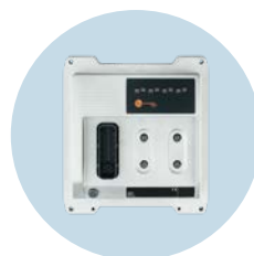
ecomatController Potenti controller da 32 bit controllano gli AGV in modo affidabile