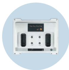
ecomatController Mobiltaugliche Steuerung, auch für Safety-Applikationen

Technische Änderungen behalten wir uns ohne vorherige Ankündigung vor. · 04.2024 ifm electronic gmbh · Friedrichstr. 1 · 45128 Essen