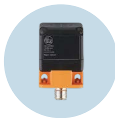
RFID Schreib- / Lesegerät Antenne und Auswertung in einem Gerät