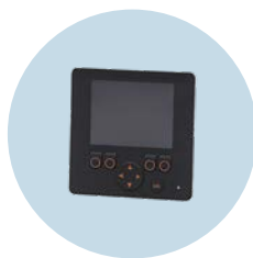
Grafikdisplay Programmierbares HMI zur Steuerung mobiler Maschinen