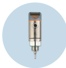
Czujnik przepływu serii SA Dokładne wykrywanie przepływu i temperatury