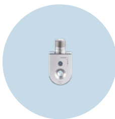
Czujnik wibracji VVB Łatwe monitorowanie stanu dla pomp