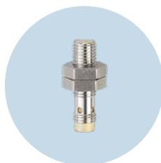
Induktive Sensoren M8 Kompakte Bauform mit hohem Schaltabstand