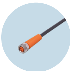
Anschlusskabel M8 Zuverlässige Verbindungen für raue Umgebungen

Technische Änderungen behalten wir uns ohne vorherige Ankündigung vor. · 04.2024 ifm electronic gmbh · Friedrichstr. 1 · 45128 Essen