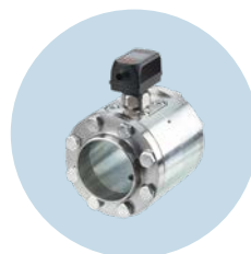
Medidores de ar comprimido Medição precisa de vazão e consumo