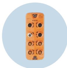
Mestres IO-Link Mestres de campo com interface Profinet