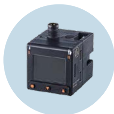
Sensores de pressão Especialmente para processos pneumáticos

Sujeito a alterações técnicas sem aviso prévio. - 04/2024 ifm electronic gmbh · Friedrichstr. 1 · 45128 Essen