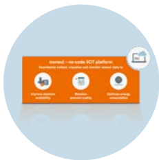
moneo IIoT Core Cloud moneo IIoT 플랫폼 클라우드 구독