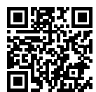
상세기술 데이터: ifm.com/fs/EIO344