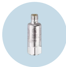
VVB 진동 센서 IO-Link를 통한 손쉬운 상태 모니터링