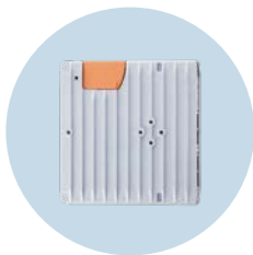
edgeGateway 시스템 데이터를 IT 레벨로 안전하게 전송하는 용도

기술변경은 사전에 통보되지 않습니다. · 04.2024 ifm electronic gmbh · Friedrichstr. 1 · 45128 Essen