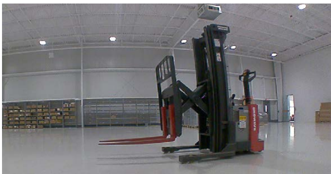
A plataforma robótica capta a situação em uma imagem 2D e em dados de distância 3D.

O usuário pode definir zonas na forma de polígonos segmentados nas quais o sistema avalia a ocupação e fornece ao sistema de direção do veículo dados claros para uma condução segura e sem colisões.