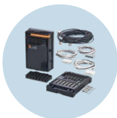
Modulo I/O per telecamera Per l'integrazione in sistemi senza CAN-bus