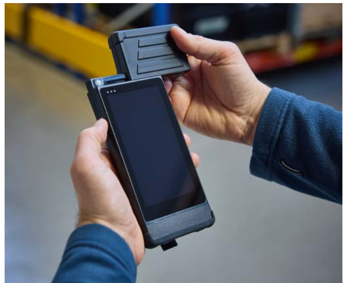
Los distintos módulos de antena situados en la parte superior del lector portátil se pueden sustituir fácilmente.