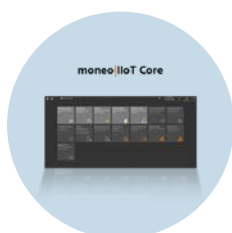
moneoIIoT Core 状態監視を手軽に実現するIIoTソフトウェア

製品改良のため、記載事項を予告なしに変更する場合があります。09.2025 ifm electronic gmbh · Friedrichstr. 1 · 45128 Essen