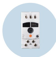
edgeGateway フィールドアプリケーション 過酷な産業環境で安全にデータを伝送