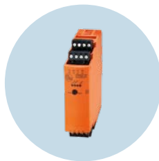
스위칭 앰프 높은 전류 또는 대체 전류의 신뢰성있는 스위칭