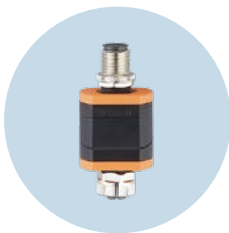
릴레이 어댑터 입력 및 출력 사이의 전기적 분리