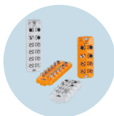
IO-Link 主站 將資料和參數傳輸到 PLC