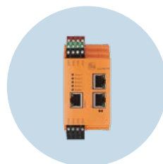
진단 전자장치 기계 및 장비의 진동 모니터링