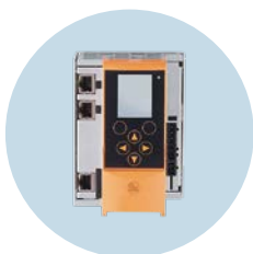
스마트 PLC 센서 액추에이터 레벨과의 데이터 교환용