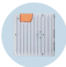
edgeGateway Per la trasmissione sicura dei dati dell'impianto al livello IT