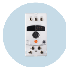
edgeGateway per applicazioni sul campo Trasmissione sicura dei dati in ambienti industriali difficili