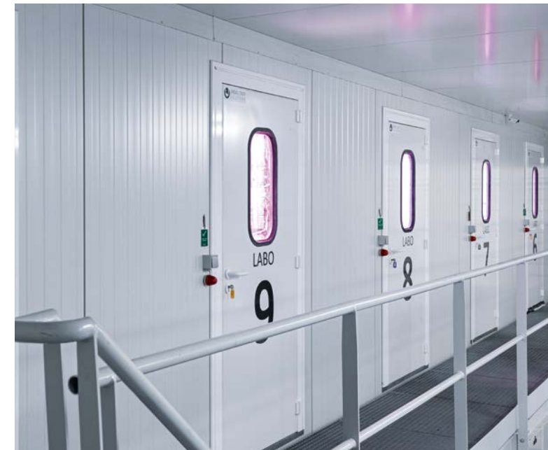
Au sein de ses propres laboratoires, Urban Crop Solutions mène des recherches sur les plantes pour le présent et l'avenir.

« Les plantes peuvent être cultivées avec une consommation d'eau qui équivaut à cinq pour cent de la consommation d'eau d'une culture de plantes classique. De plus, les plantes peuvent être produites au plus près du consommateur final, ce qui permet de réduire davantage l'impact environnemental. Pour