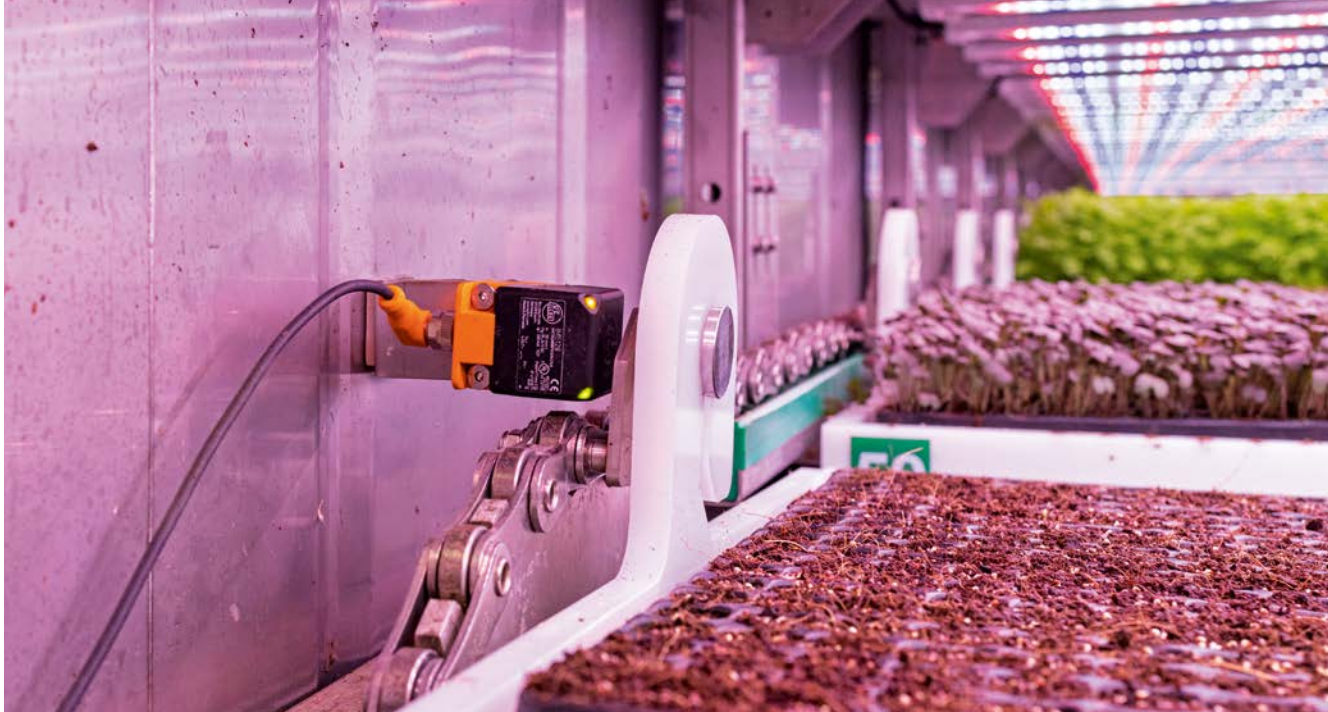
Les capteurs inductifs d'ifm assurent le déroulement sécurisé des processus de transport dans le ModuleX.