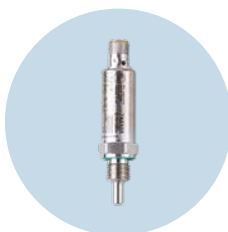
온도 센서 신뢰성있는 온도 측정