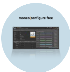
moneo|configure free Logiciel pour le paramétrage de l'infrastructure IO-Link

Nous nous réservons le droit de modifier les données techniques sans préavis. - 04.2024 ifm electronic gmbh · Friedrichstr. 1 · 45128 Essen