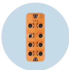
Mestre IO-Link Mestres de campo com interface PROFINET