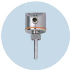
SI500A 流量感測器 測量 2 區和 22 區的液體和氣體