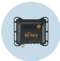
io-key Envío de datos de sensores a la nube a través de la red móvil