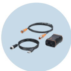
Interfaz IO-Link Para la parametrización de equipos IO-Link en el PC

Nos reservamos el derecho de modificar características técnicas sin previo aviso. · 11.2024 ifm electronic gmbh · Friedrichstr. 1 · 45128 Essen