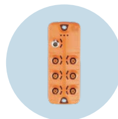
IO-Link M12 模組 將二進制感測器連接到 IO-Link 主站